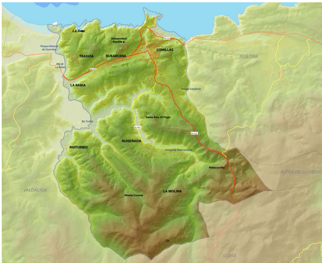
Mapa 1. Encuadre territorial de Comillas.

El ámbito del Catálogo, por tanto, será el Suelo Rústico del municipio de Comillas definido por el PGOU y su objeto serán todas las construcciones y edificaciones que se localicen en él sean o no catalogadas.