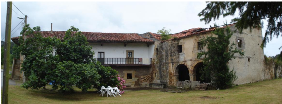
Imagen 26. Conjunto de Casona-torre de Bracho en Ruiseñada.

Como en toda Cantabria, en Comillas aparecen casas palacio con detalles de arquitectura culta, producto de la influencia foránea aportada por los distintos grupos de canteros. Existen algunas casonas de dos plantas de los siglos XVII y XVIII, con arcos de medio punto, carpaneles o rebajados, en que a menudo hacen su presencia los grandes escudos. Como pieza singular destaca el palacio de los Bracho, adosado a la torre medieval, cuyo conjunto incluye una capilla exenta, hoy muy transformada.