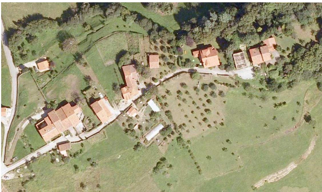
Imagen 7 Hileras de casas adosadas dispuestas paralelas al camino

Las hileras de casas adosadas se sitúan buscando la mayor idoneidad topográfica y una buena orientación. Al ser estos factores más determinantes que la dirección de los caminos, encontramos dos modos característicos y opuestos de disposición de las hileras, ya sea dispuestas paralelas al camino, ya sea perpendicular a este.