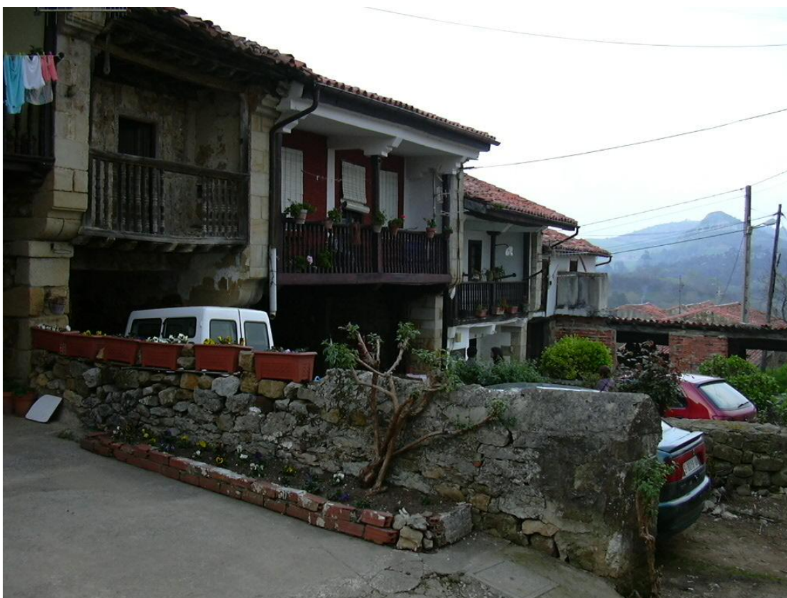
Imagen 16. Barriada formada a partir de viviendas tradicionales adosadas en La Molina.