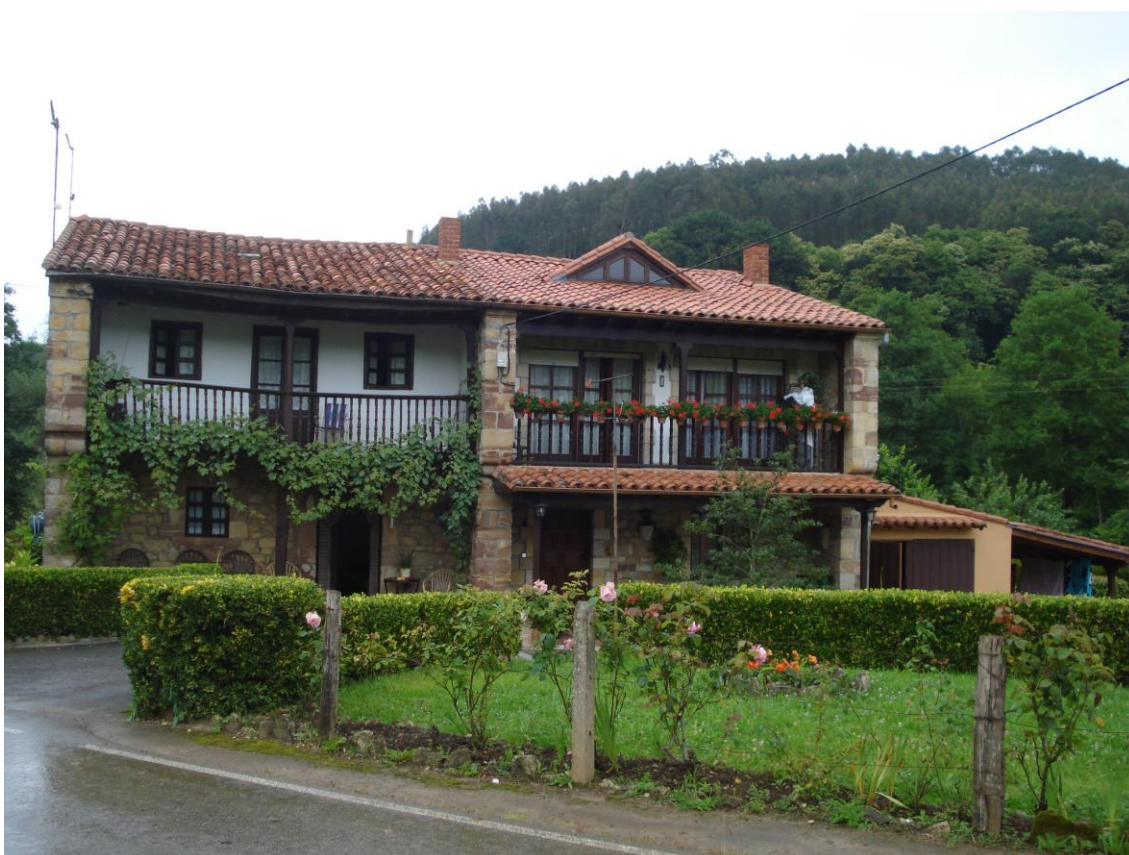
Imagen 15. Casa de dos plantas adosadas en Ruiseñada.