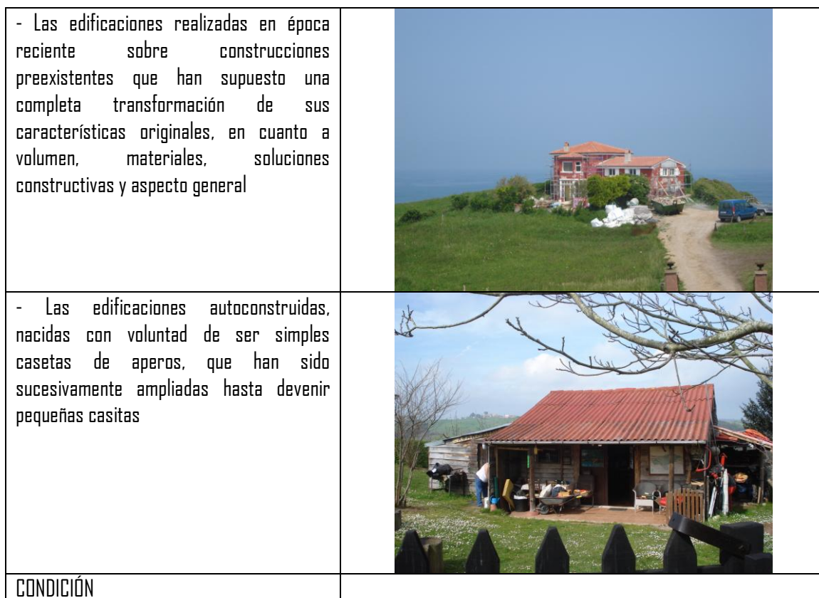
Cuadro2. Resumen de condicionados de exclusión.