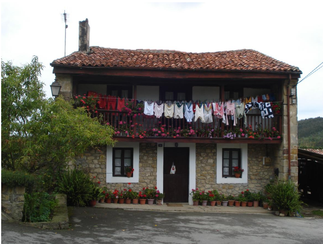
Imagen 14. Vivienda tradicional aislada en El Cajigal.