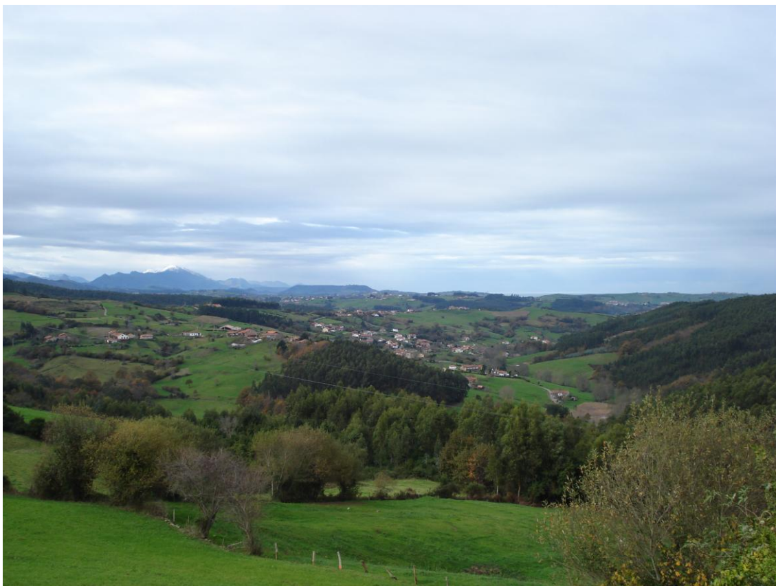
Imagen 2. Un paisaje singular obtenido desde la suma de arquitecturas diversas en contrastado dialogo con los elementos naturales.

El paisaje rural del municipio de Comillas es el resultado de una serie de procesos de transformación, dando como resultado un territorio fuertemente.