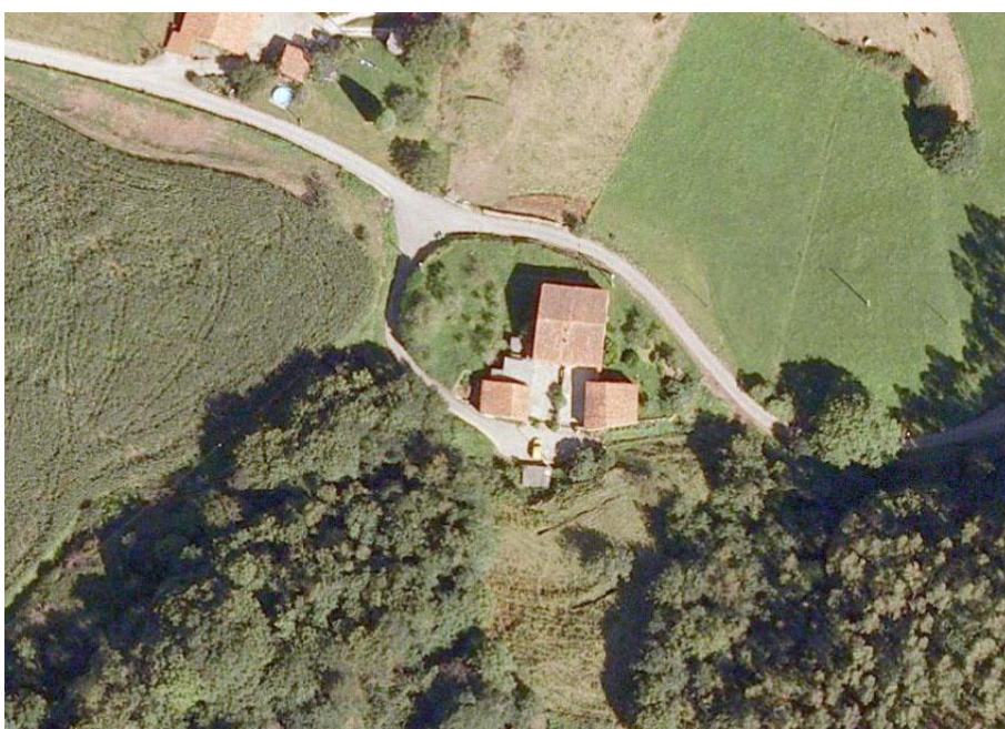
Imagen 9. Excepcionalmente aparecen algunas viviendas aisladas o formando agrupaciones mínimas. Siempre se sitúan, sin embargo, en la cercanía de los barrios. Unidad denominada El Corral en Solapeña, Ruiseñada. Compuesta por una vivienda y varias construcciones auxiliares.