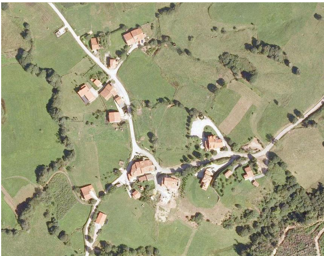
Imagen 5. Ortofoto del núcleo de Rioturbio .

Rioturbio es una pequeña aldea formada por distintas agrupaciones de casas adosadas semidispersas, ligadas por los caminos, sin que ni siquiera la existencia de la ermita de San Miguel llegue a crear un espacio público de referencia.