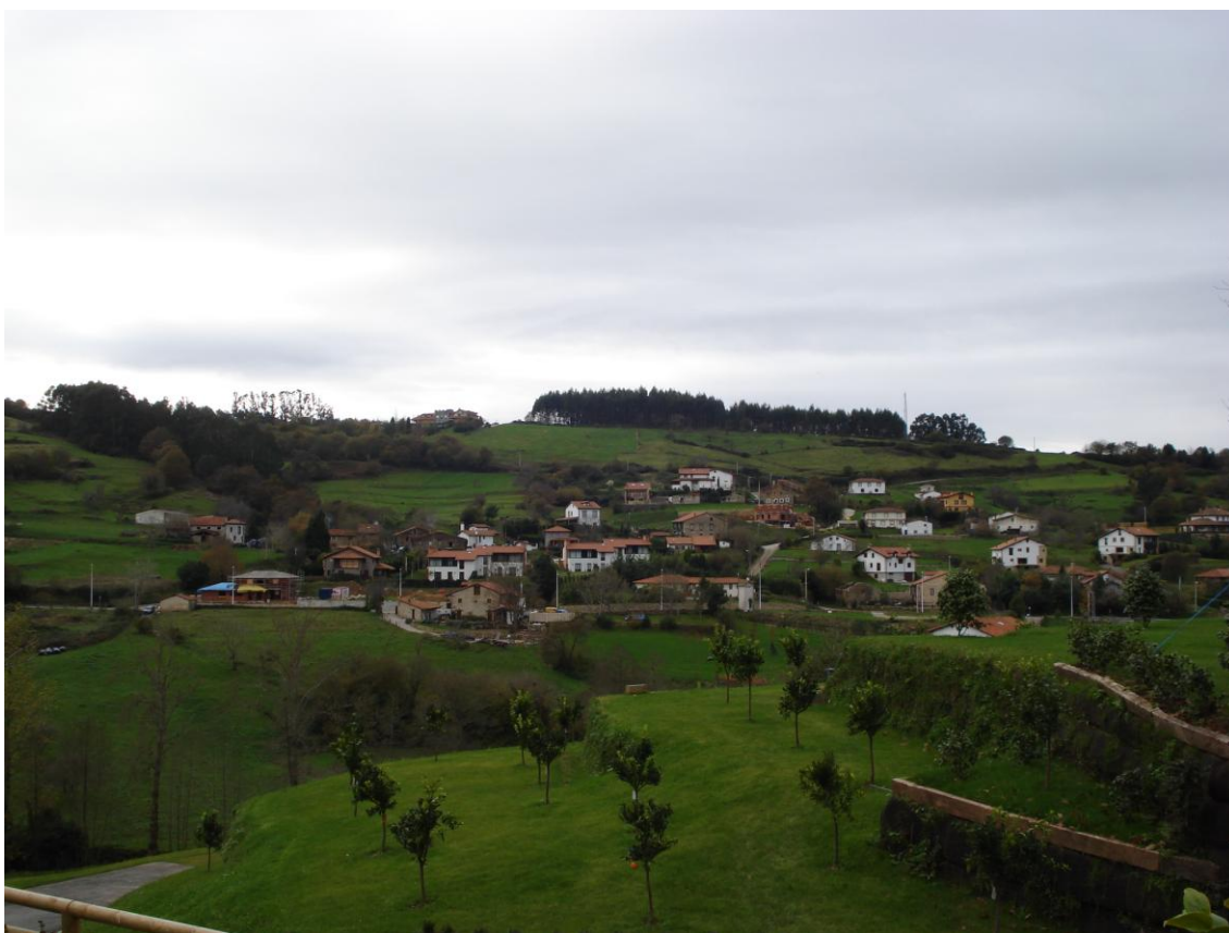
Imagen 6. Barrio de El Valle en Ruiseñada

En la zona más alta, en Araos se está desarrollando una zona de vivienda unifamiliar aislada en parcelas grandes, aprovechando las magníficas vistas del lugar, destacando la visión de la Universidad Pontificia de Comillas al Noreste.