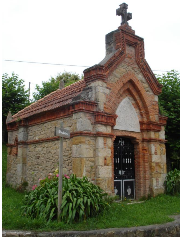
Imagen 23. Ermita del Sagrado Corazón en El Pisgu.