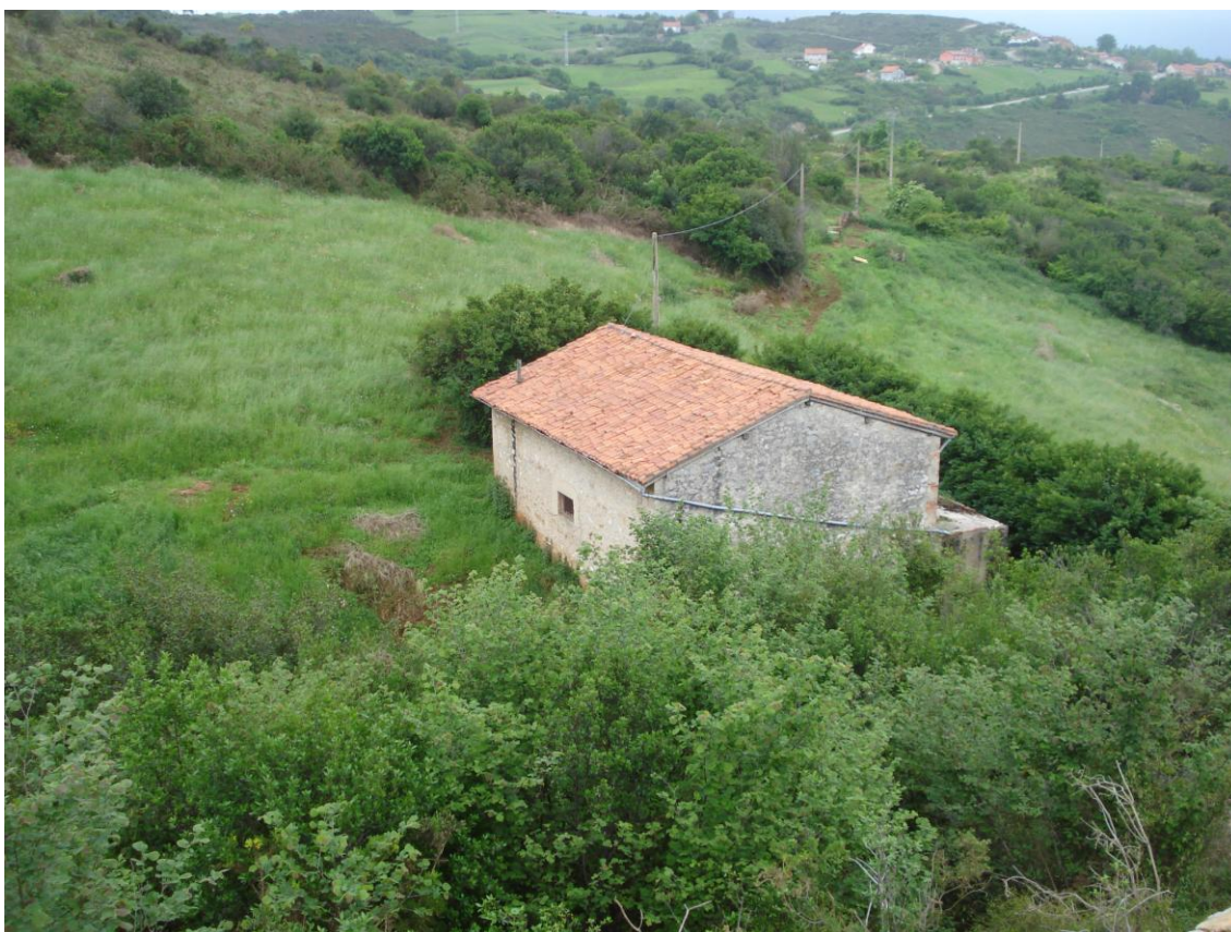
Imagen 17. Cabaña ganadera tradicional de volumetría sencilla y aislada en el paisaje junto a la cantera de Peñacastillo.

Este papel de volumen aislado en el paisaje es condición a tener en cuenta a la hora de regular sus posibilidades de crecimiento