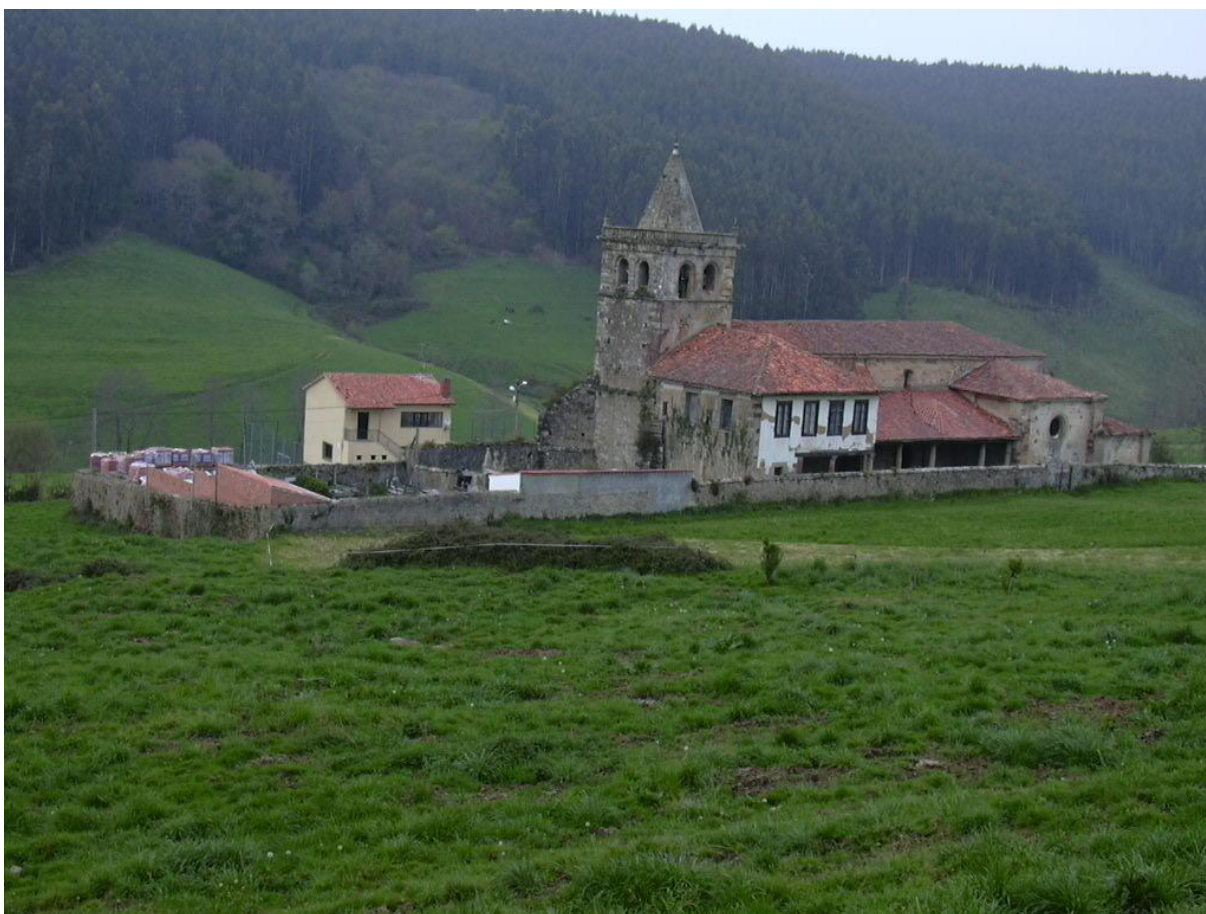
Imagen 22. Iglesia parroquial de San Adrián de Ruiseñada

El municipio de Comillas se divide en dos parroquias, los dos templos parroquiales tiene una cierta homogeneidad estilística, pues son producto de épocas cercanas, siglos XVI a primera mitad del XVIII, compartiendo un volumen muy compacto y la gran torre de planta cuadrada. En cada uno de los barrios , sin embargo existen ermitas, cada una con una advocación característica, jugando un cierto papel de organización formal del conjunto. Otras ermitas se sitúan aisladas, como la de San Esteban, en el Monte Corona, casi siempre de origen medieval. Por todo el Municipio existen varios humilladeros, siempre situados junto a los caminos. La mayoría de estas edificaciones posee un valor arquitectónico menor, pero son poseedoras de un importante significado histórico.