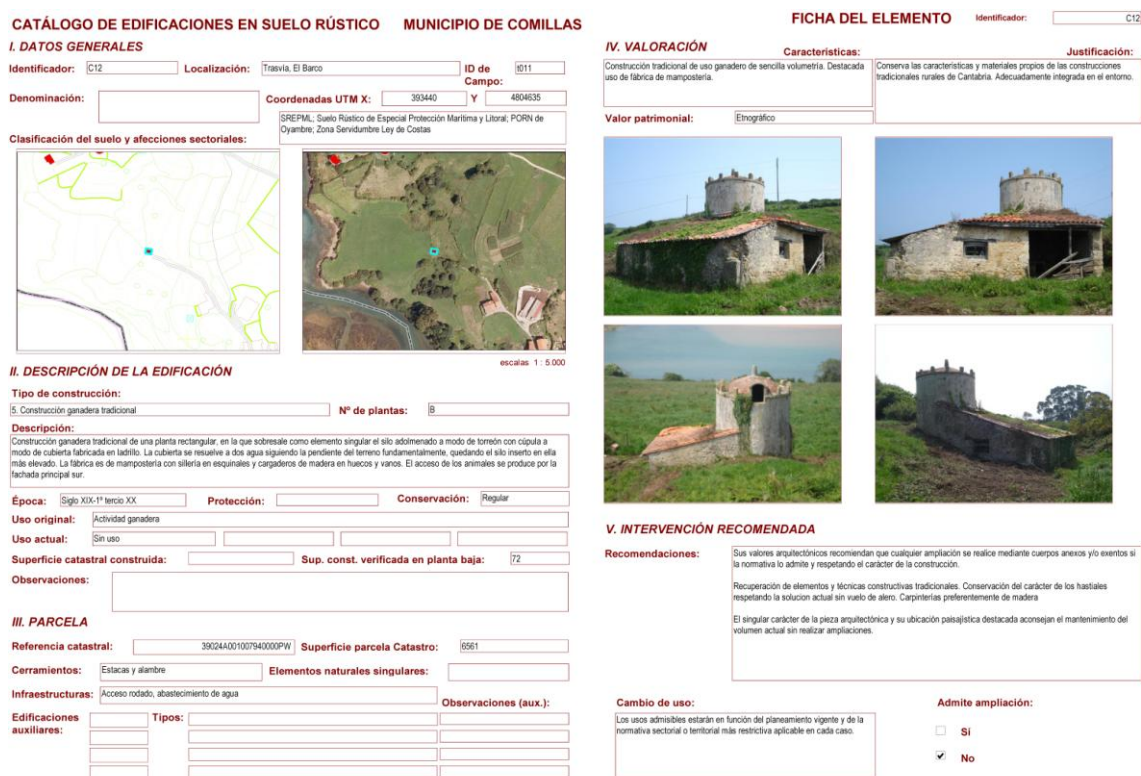
Imagen 1. Ficha C12 del Catálogo de Edificaciones.