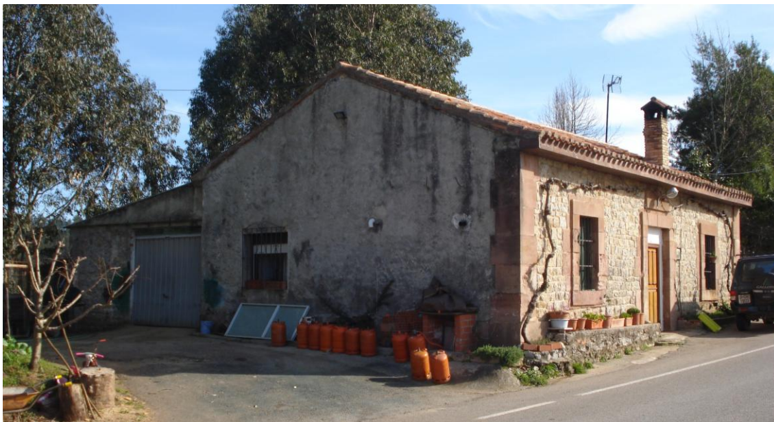
Imagen 29. Antigua Casa de los peones camineros en carretera CA-135.

Escuelas, mercados, lavaderos y otros edificios menores de uso público. En distinto estado de uso y conservación.