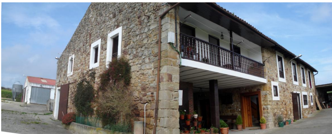
Imagen 20. Construcción de dos plantas, con división horizontal de usos, situando los espacios ganaderos en la planta baja y la vivienda en la planta superior.