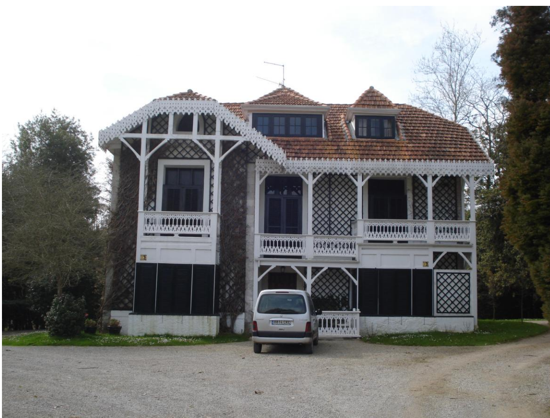
Imagen 21. Casa de estilo ecléctico en La Rabia, conocida como Casona del Inglés.

Son villas y palacetes contruidos a caballo del cambio de siglo que hacen su aparición en la comarca a menudo ligadas a capitales indianos; se plantean en los más diversos estilos historicistas de la arquitectura ecléctica, con volumetrías a veces muy complejas. En el municipio los ejemplos más interesantes se sitúan en las cercanías de Comillas; originalmente en la periferia de los barrios tradicionales hoy aparecen integrados en las tramas urbanas. Casi siempre se sitúan en medio de grandes fincas cercadas, con presencia de arbolado exótico. Habitualmente poseen estructura de muros de carga, en mampostería con uso limitado de sillería. Pueden aparecer en ocasiones otros tipos de materiales industriales en estructura y acabados, incluido algunos de procedencia foránea y urbana (piezas de pizarra, cerámica de color, estructura de hierro forjado).