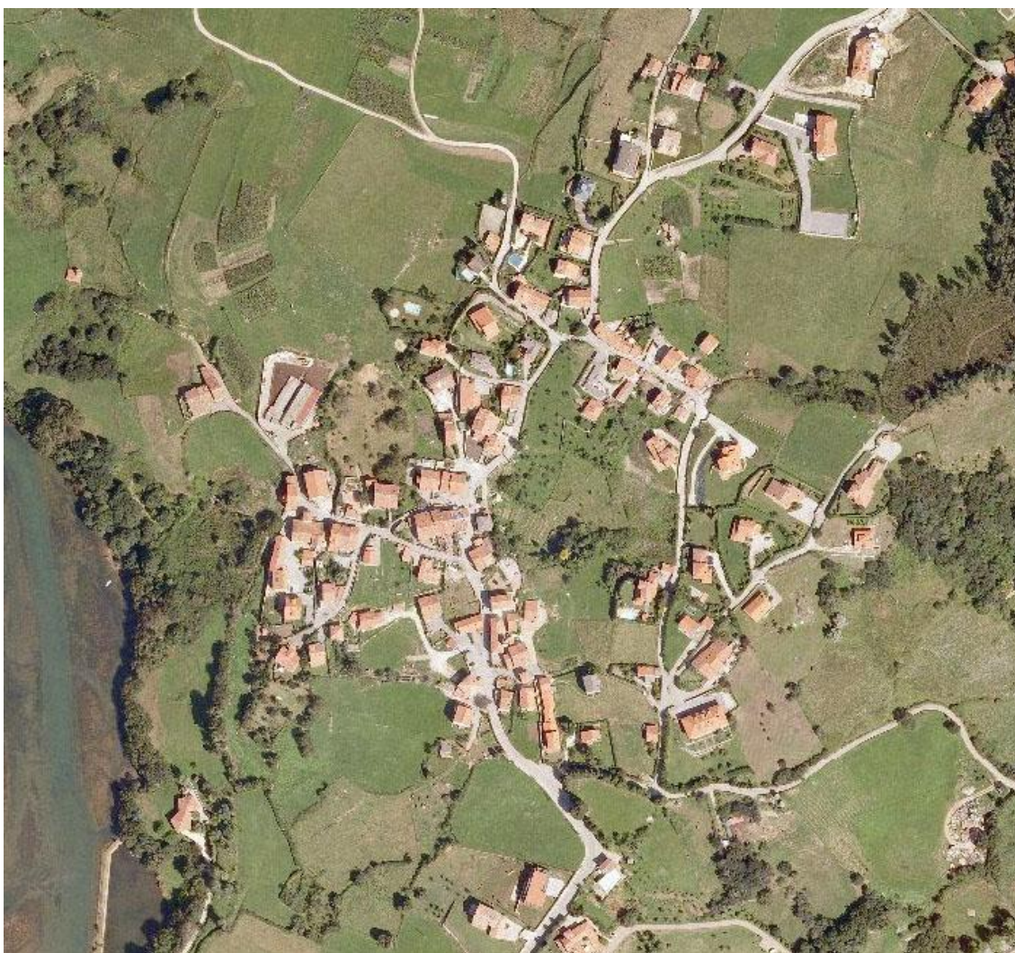
Imagen 4. Ortofoto del núcleo de Trasvía .

Trasvía es núcleo de estructura laxa, compuesto por varias hileras de casas tradicionales, organizadas según una compleja red de caminos. Amplias zonas cercadas caracterizan su morfología. Su cercanía a Comillas y a las playas, han producido aquí un gran desarrollo de edificaciones unifamiliares, de irregular calidad, pero casi siempre contrastando negativamente con la calidad del conjunto edificado tradicional.