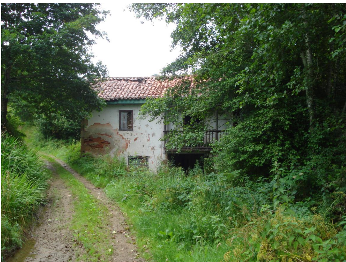
Imagen 28. Molino de La Peñuca en Ruiseñada

Dos son los molinos hidráulicos existentes, denominados de Cubón y de La Peñuca, ambos conservados en estado ruinoso. Son sin embargo importante testimonio de una importante actividad preindustrial cuya posesión se disputaban los distintos señores del lugar.