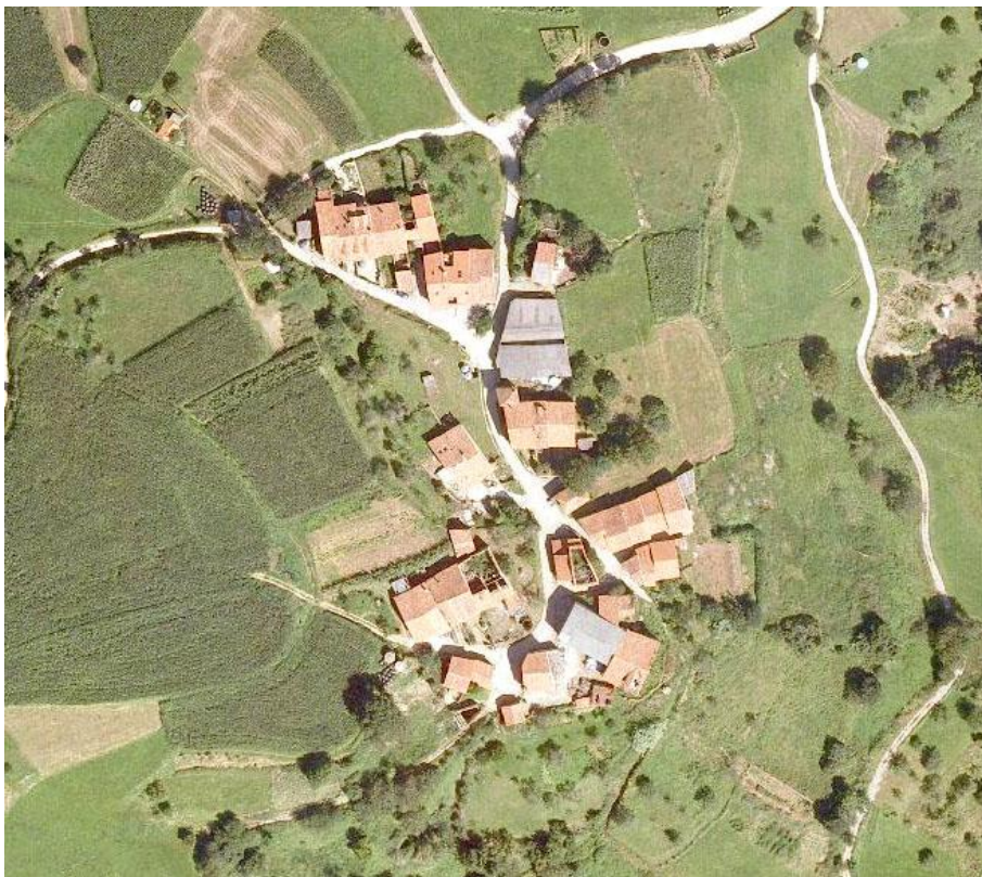
Imagen 8. Hileras de casas adosadas dispuestas perpendicularmente al camino