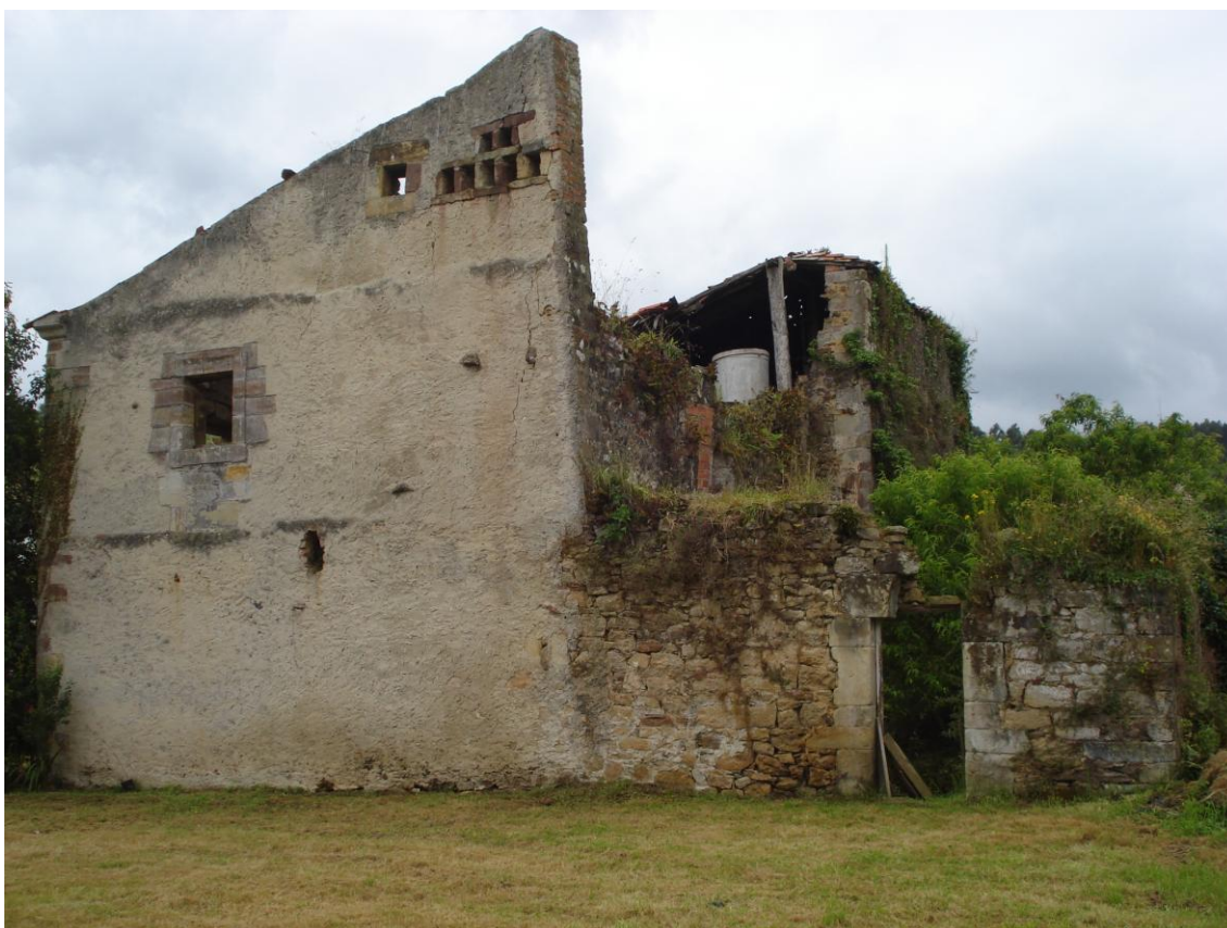
Imagen 25. Restos de la Torre medieval de Bracho en Ruiseñada.

En el municipio existieron varias torres defensivas medievales, de las que apenas se conservan restos en la actualidad. El más importante fue el castillo de Peñacastillo, que ha sido fruto de investigación arqueológica. La importante torre familiar de Bracho, en Ruiseñada, se conserva en avanzado estado de ruina, formando parte de un conjunto edificado posterior. De la torre que pudo existir en Comillas, que ha dejado los topónimos Solatorre y barrio de El Castillo, no se conserva resto alguno. De la posible torre que la documentación bajomedieval sitúa en el entorno de la Peluca se desconoce su ubicación exacta.