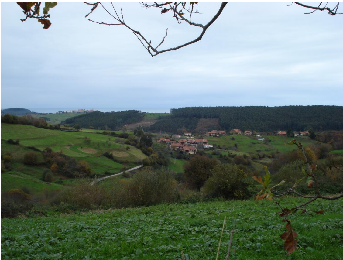
Imagen 3. Barrios tradicionales de casas adosadas, en inmediata relación con los espacios de mies y terrazgos.

Nunca demasiado alejados de los núcleos se sitúan los espacios de cultivos, mieses y terrazgos, a los que siempre se han reservado las mejores orientaciones y suelos. La ganadería se desarrollaba en terrenos más alejados del hábitat aldeano, siendo de especial importancia la existencia de prados comunales, usados por el ganado.