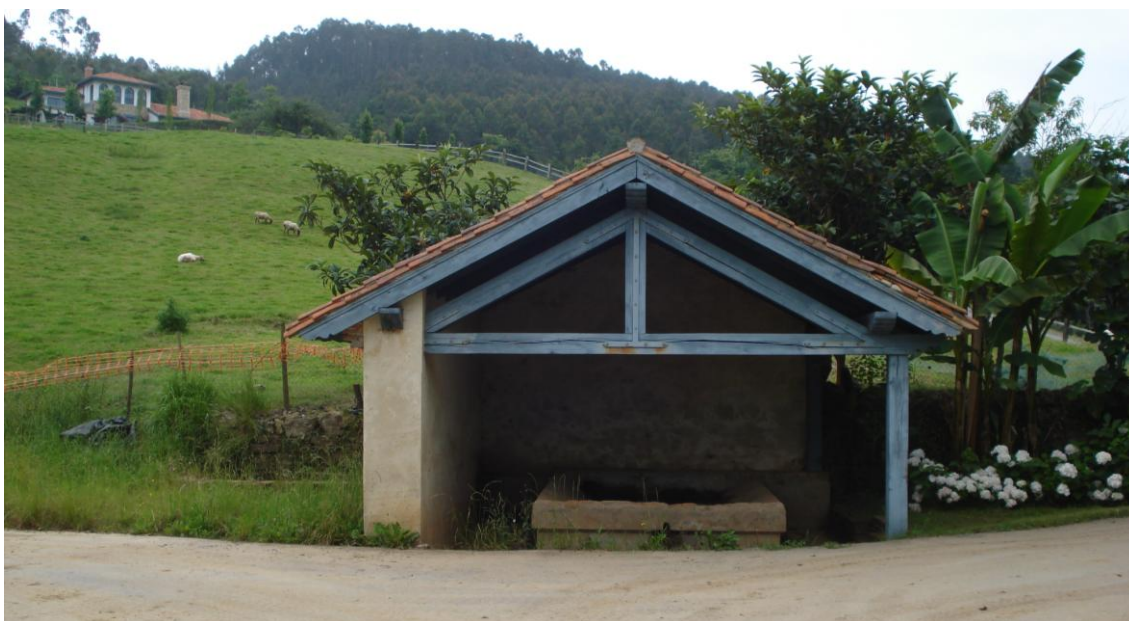
Imagen 30. Lavadero en el Valle (Ruiseñada)