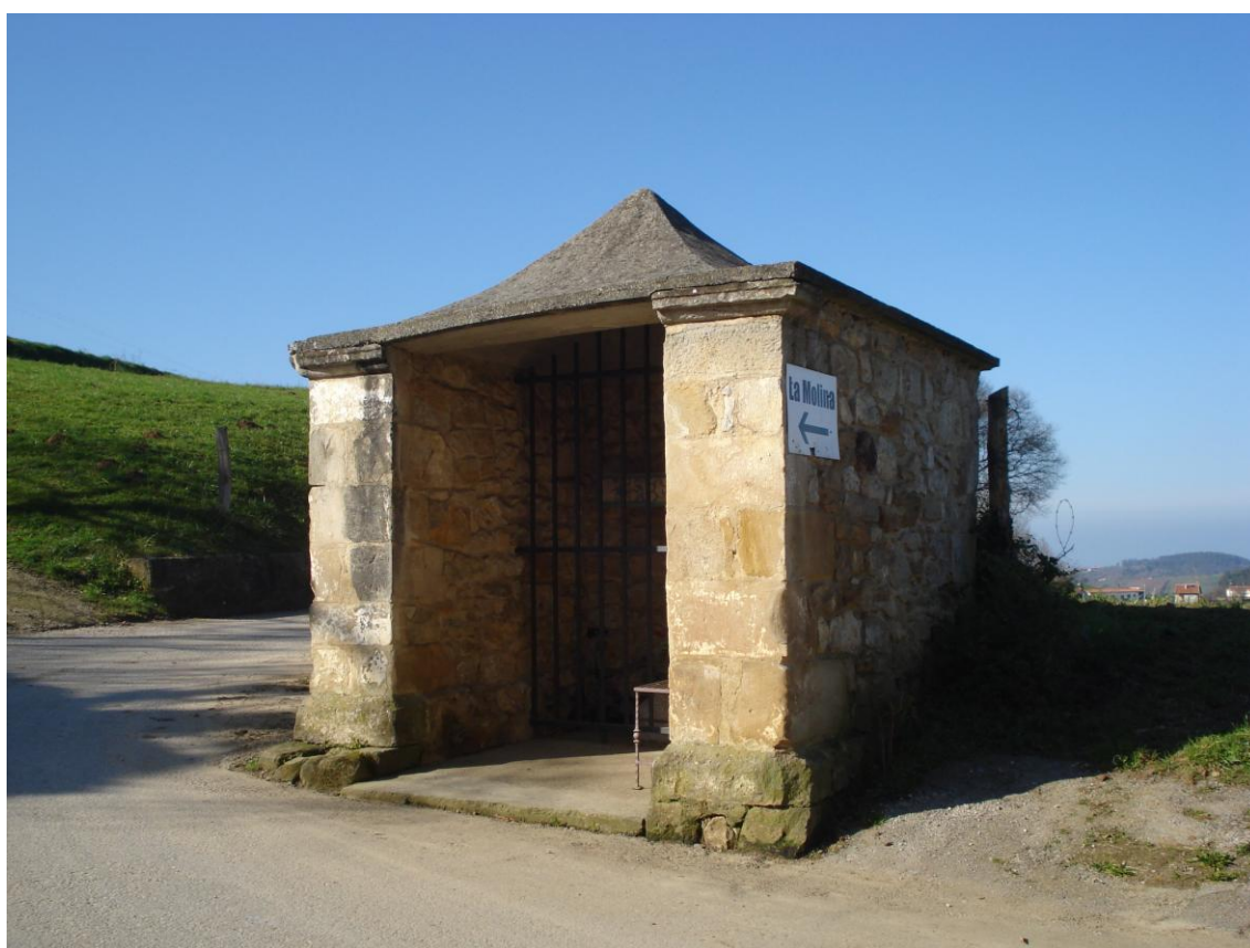
Imagen 24. Humilladero en La Molina.