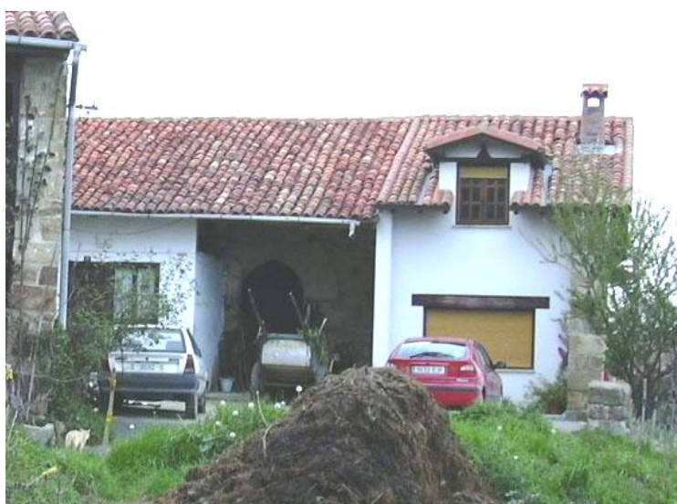
Imagen 12. Casa Llana en Araos, con diversas transformaciones posteriores.

Si en otras zonas de Cantabria (Cabuérniga, Miengo) ha sido estudiada su extensión, aún no existe un catálogo de estas construcciones en el occidente cántabro. En el municipio de Comillas existen algunas de estas características, casi siempre transformadas, cuya antigüedad cabe sospechar.