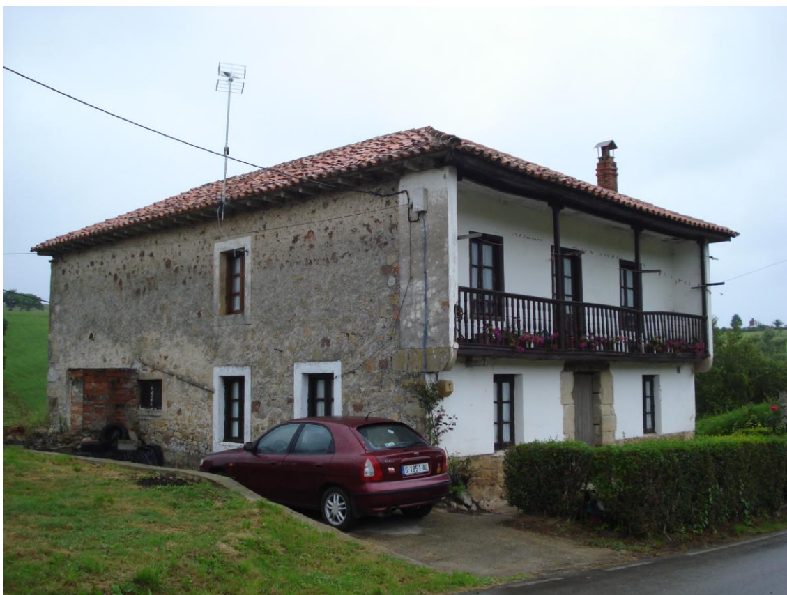
Imagen 13. Casa de dos plantas aislada en carretera a Ruiseñada (CA-362).

En este tipo de edificio se da con frecuencia una imitación de las formas cultas de casonas, con muros cortavientos decorados y otros elementos decorativos.