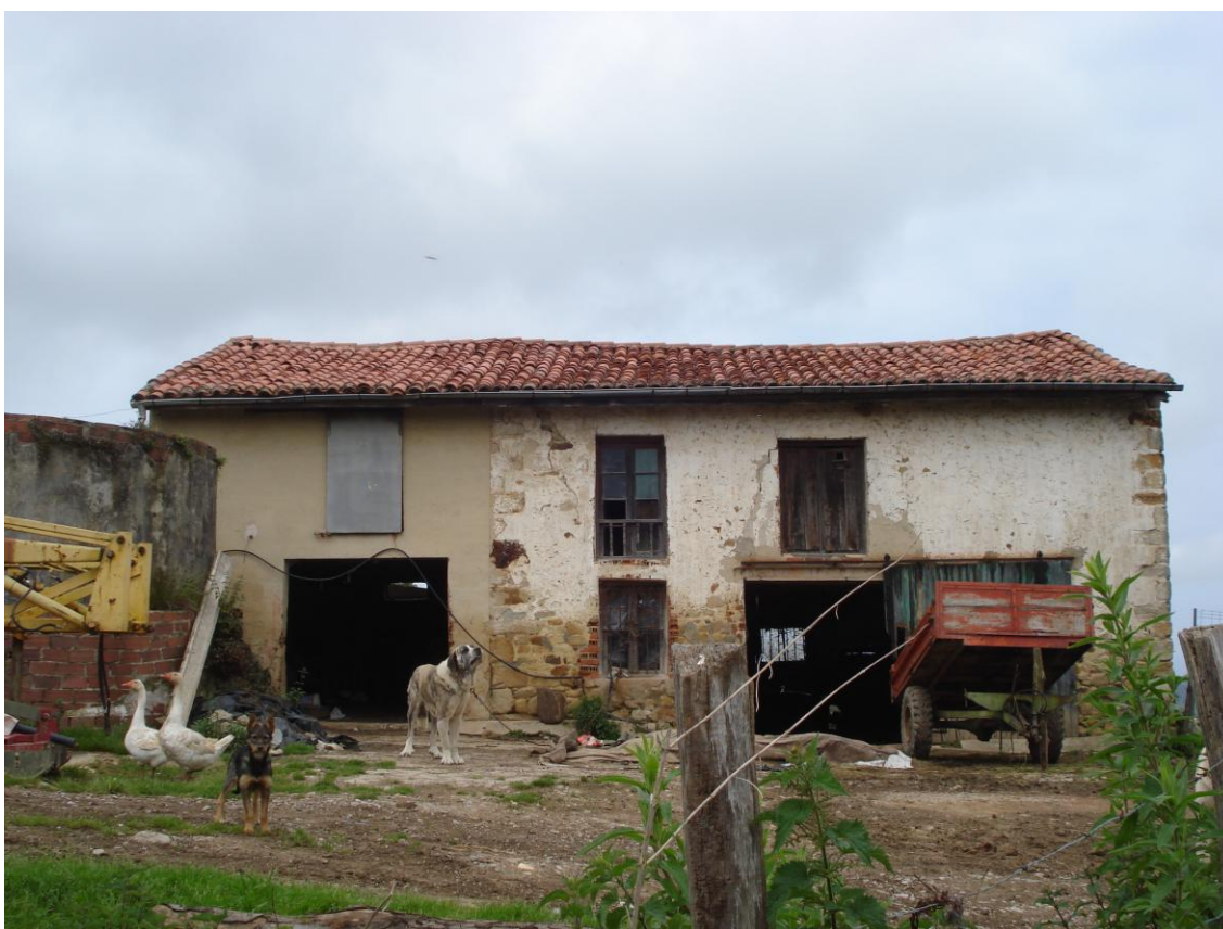
Imagen 18. Construcción de dos plantas, con división vertical de usos, situando los espacios ganaderos a la izquierda y una sencilla vivienda a la derecha, ubicada en Monte Corona.

Comúnmente poseen estructura de muros de carga, resueltos en mampostería, con un uso limitado de sillería en los esquinales y marcos de huecos. Puntualmente pueden aparecer materiales industriales, ladrillo macizo, teja plana.