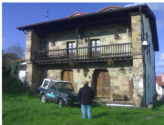
Imagen 27. Casona palaciega en Ruiseñada.