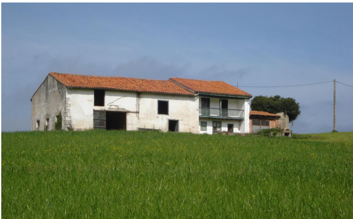
Imagen 19. Construcción de dos plantas, con división vertical de usos, situando los espacios ganaderos y el pajar a la izquierda y una vivienda resuelta en dos plantas a la derecha.